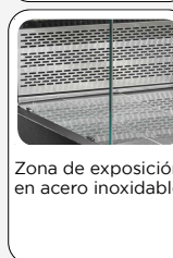
Zona de exposición en acero inoxidable