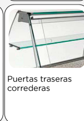
Puertas traseras correderas