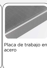
Placa de trabajo en acero